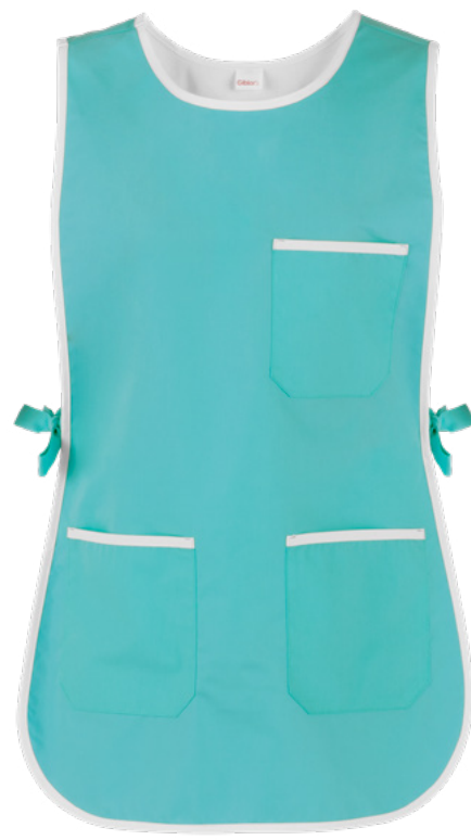
M19 Verde acqua