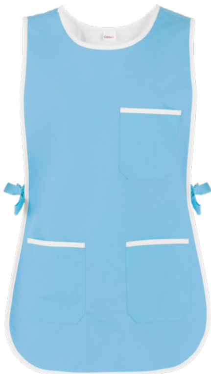
C08 Azzurro chiaro